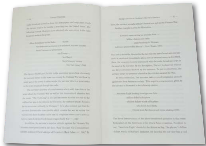
Tanioka Tomomi, "Energy of Vortex in Ginsberg's The Fall of America " pp.44-45.